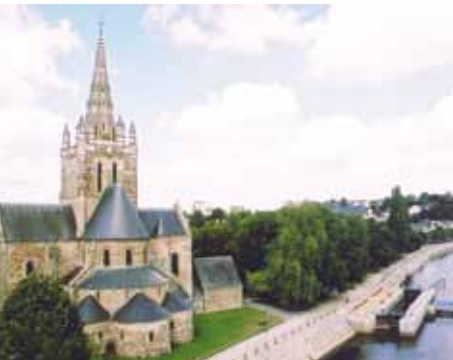
La basilique d'Avesnières

Édifiée à partir de 1485 à la demande des habitants du faubourg situé sur la route de Paris, ce monument verra l'élévation s'achever en 1565 par la construction d'un chœur voûté en coupes. A l'opposé, la nef se voit dotée d'un portail monumental adoptant la forme d'un arc de triomphe à l'antique. Celui-ci est largement inspiré des travaux réalisés à Saint Andréa de Mantoue par le grand architecte italien Alberti. Ornant le bras gauche du transept, la grande verrière de la Crucifixion, attribuée à Arnoult de Nimègue, témoigne de la qualité de l'art du vitrail au 16 ème siècle, ainsi que du mécénat actif de la bourgeoisie marchande.