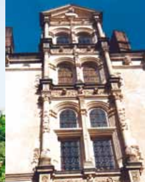
Le Grand Veneur