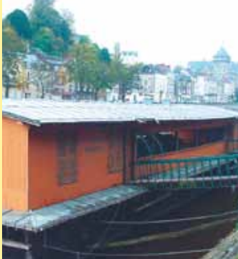
Le bateau Lavoir St-Julien

Départ : Vieux pont Durée du circuit : 35 mm