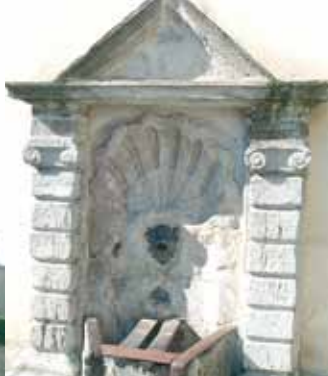
La fontaine du four à ban