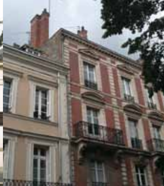
Immeuble rue de la Paix