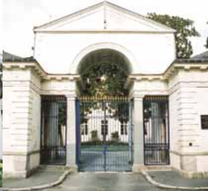
Le portail de la Préfecture