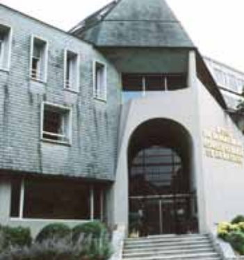
L'Hôtel du Département