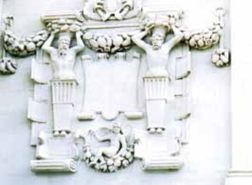
Détail de la galerie renaissance