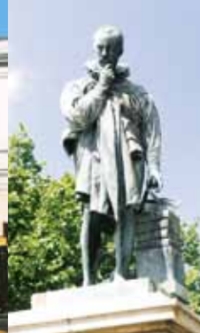
Statue d' A. Paré