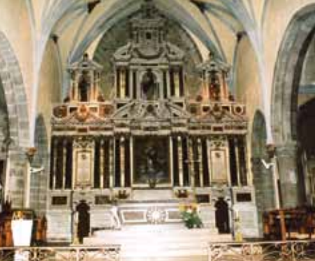
Maître autel des Cordeliers