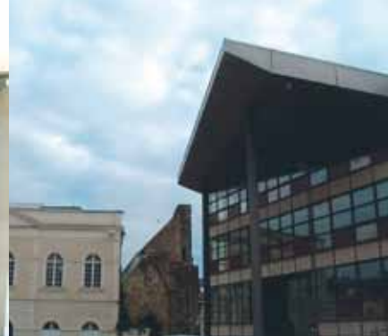
La place Saint-Tugal