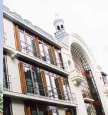
Le nouveau palais de justice

En partie basse de vallée le pouvoir Napoléonien développe une ville moderne au début du 19 ème siècle, le long d'une nouvelle traverse est/ouest. La ville médiévale quant à elle occupe les hauteurs de la rive droite. C'est là, le long d'une ancienne voie romaine, que les seigneurs de Laval, puis de Laval/Vitré ont pu créer, dominant le passage sur la rivière Mayenne, un des plus importants ensembles civil et militaire de l'ouest.