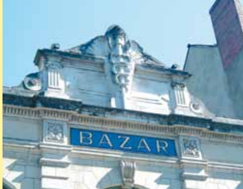
Le grand bazar de Paris

Départ : Médiapole Durée du circuit : 35 mm