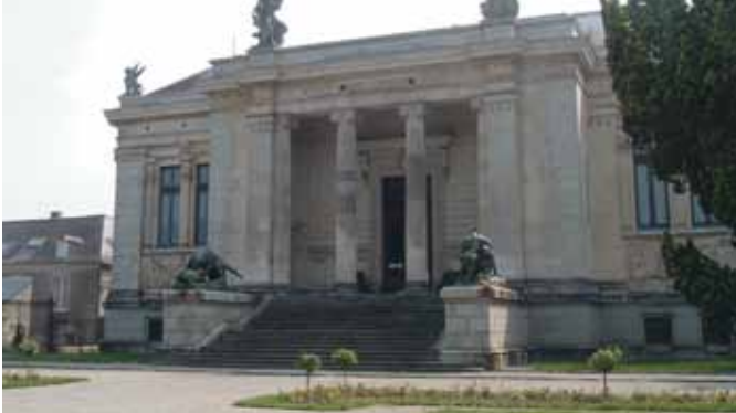
Le Musée des beaux arts