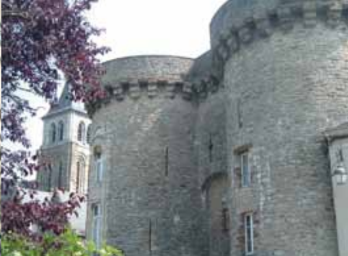
La porte Becherresse