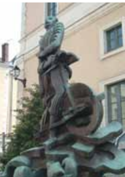
Jarry par Zadkine