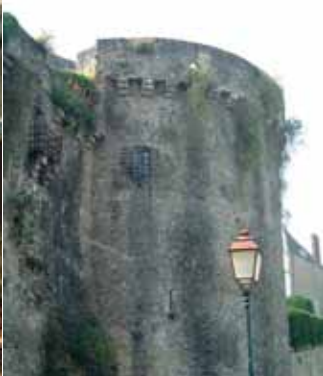
La tour Renaise