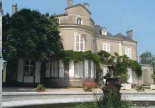
Le musée école de la Perrine