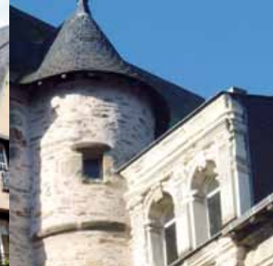
L' hôtel de Brée