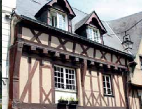
La maison du Pou Volant