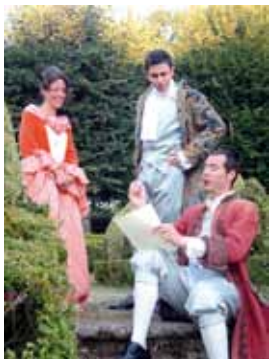
Deux animations estivales : les kids du patrimoine et les visites théâtrales