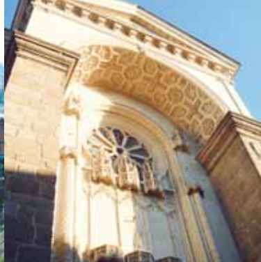
Détail du portail et la grande verrière de Saint-Vénérand