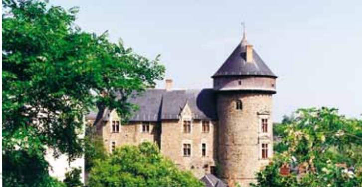
Le Vieux Château