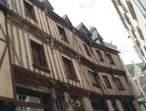
L'Hôtel de Clermont