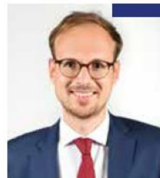
Florian BERCAULT PRÉSIDENT DE LAVAL AGGLOMÉRATION

« Nous avons la volonté de transporter plus de salariés en direction de leur travail et donc vers les zones d'activités économiques. Pour cela, le réseau va être densifié, avec une amplitude horaire plus grande, le matin et le soir, des bus davantage présents le week-end et notamment le dimanche sur Laval, mais aussi sur la première couronne de l'agglomération. »