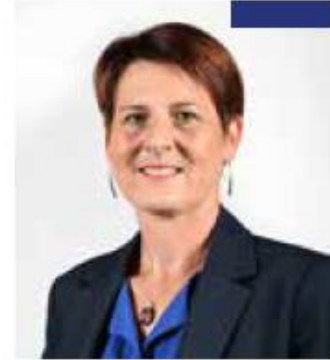
ISABELLE FOUGERAY VICE-PRÉSIDENTE DE LAVAL AGGLOMÉRATION EN CHARGE DES TRANSPORTS ET DÉPLACEMENTS ET MAIRE DE LA CHAPPELLE ANTHENAISE

Le réseau TUL va trouver un nouveau souffle à partir du 4 septembre grâce une refonte complète de ses lignes, avec davantage de villes desservies, des amplitudes horaires plus étendues et un service de transports à la demande plus performant. Ce nouveau réseau a été présenté lors d'une dizaine de réunions publiques à travers l'agglomération. « Nous devons avancer en parallèle sur les infrastructures, les services et l'incitation aux changements de comportement, on joue sur ces trois tableaux en même temps », explique Isabelle Fougeray. « Il faut lutter contre l'autosolisme pour aller vers les mobilités douces, en s'appuyant dans les prochaines années sur le futur plan de mobilité simplifié ».